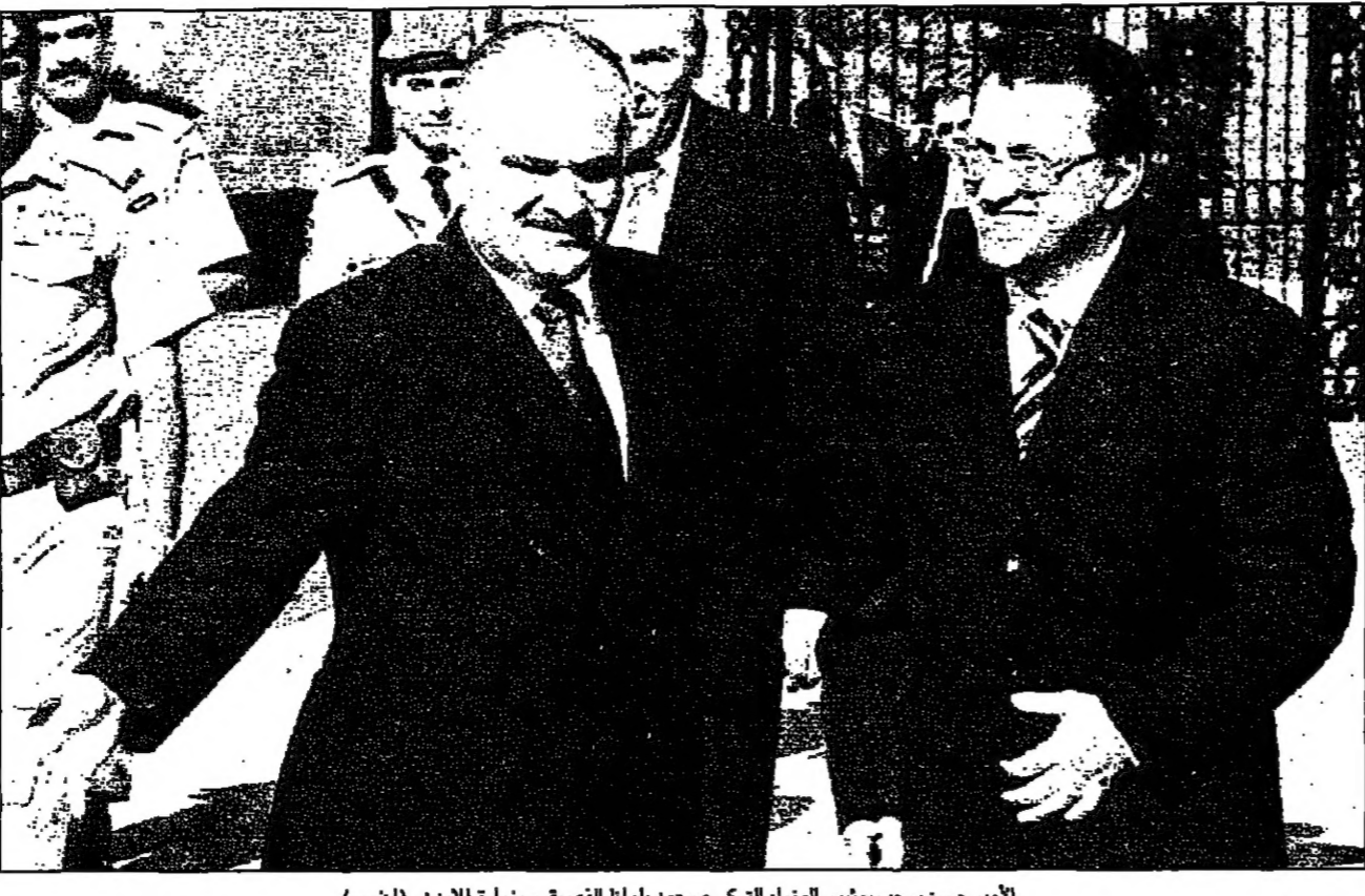
الأمير حسن يرحب برئيس الوزراء التركي مسعود يلماط الذي يقوم بزيارة للأردن

■ دمشق - رويترز - قال وزير الدفاع السوري وليد الخياط في مقابلة مع صحيفة «الشرق الأوسط» ان سوريا لا تريد ان يتحول التعاون العسكري بين سوريا وتركيا الى تحالف عسكري. وقال الخياط ان سوريا لا تريد ان يتحول التعاون العسكري بين سوريا وتركيا الى تحالف عسكري. وقال الخياط ان سوريا لا تريد ان يتحول التعاون العسكري بين سوريا وتركيا الى تحالف عسكري.